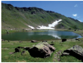
Ibón de TRUCHAS