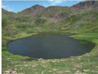
Ibón de ESCALAR